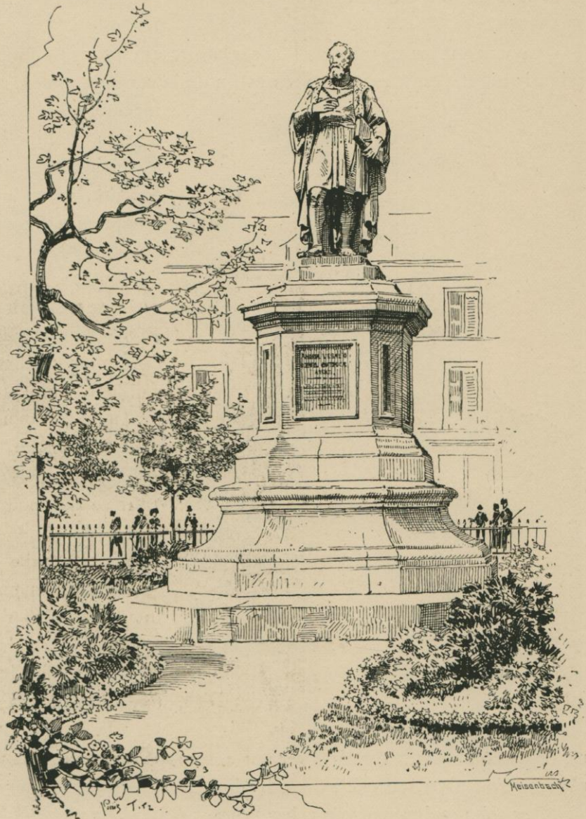
STATUE D'ANDRÉ VÉSALE, ÉRIGÉE EN 1847.

« L'adjudication publique eut lieu à l'Hôtel de ville, le 10 mai 1827... L'entre-